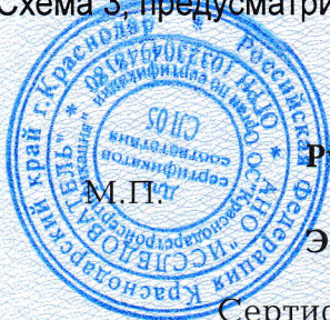
Схема 3, предусматривающая проведение инспекционного контроля не реже одного раза в год